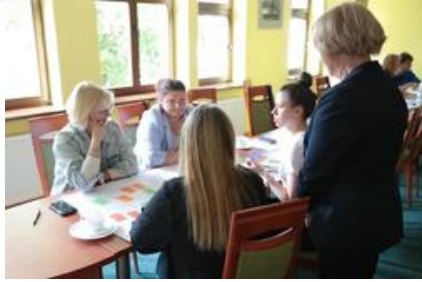
Warsztaty graficzne Sztuki Wyboru