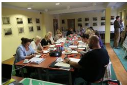
Warsztaty graficzne Sztuki Wyboru