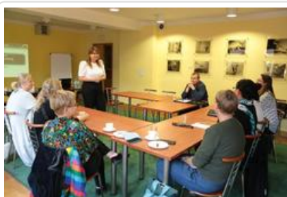
Warsztaty graficzne Sztuki Wyboru