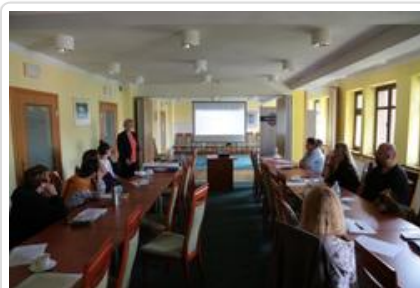
Warsztaty graficzne Sztuki Wyboru