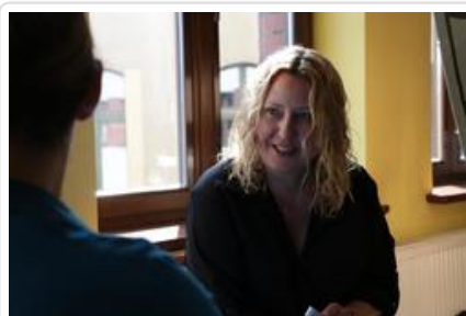
Warsztaty graficzne Sztuki Wyboru