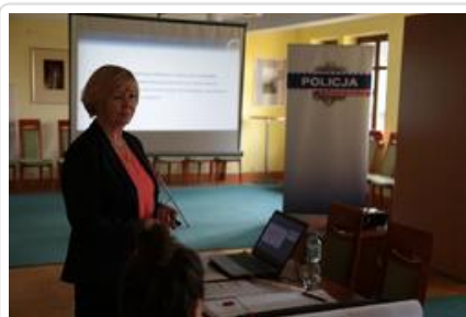
Warsztaty graficzne Sztuki Wyboru