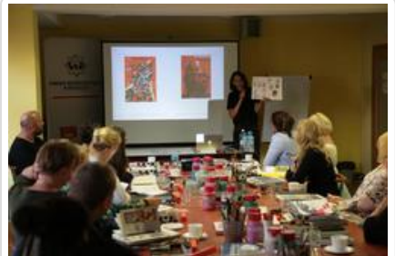
Warsztaty graficzne Sztuki Wyboru