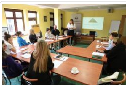
Warsztaty graficzne Sztuki Wyboru