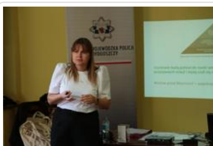
Warsztaty graficzne Sztuki Wyboru