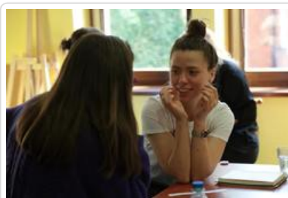
Warsztaty graficzne Sztuki Wyboru