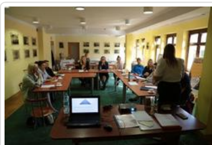
Warsztaty graficzne Sztuki Wyboru