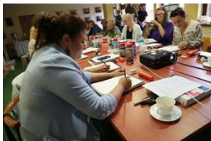
Warsztaty graficzne Sztuki Wyboru