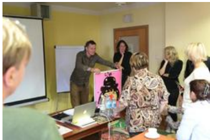
Warsztaty graficzne Sztuki Wyboru