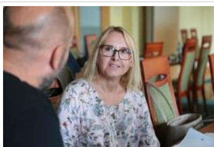
Warsztaty graficzne Sztuki Wyboru