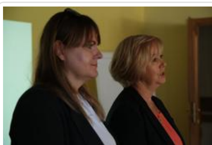
Warsztaty graficzne Sztuki Wyboru