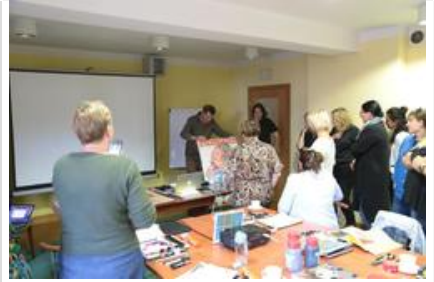
Warsztaty graficzne Sztuki Wyboru