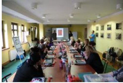
Warsztaty graficzne Sztuki Wyboru