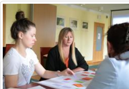
Warsztaty graficzne Sztuki Wyboru